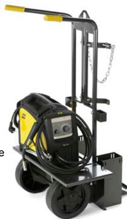
Vozík – pro snadnou přepravu zdroje Caddy® Mig a plynové lahve.