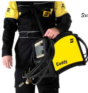
Svařovací zdroj s ramenním popruhem

Zešikmený panel, přihrádka pro náhradní a spotřební díly, držáky kabelů a hořáku při transportu, to jsou pouze některé z promyšlených detailů které pomáhají při práci.